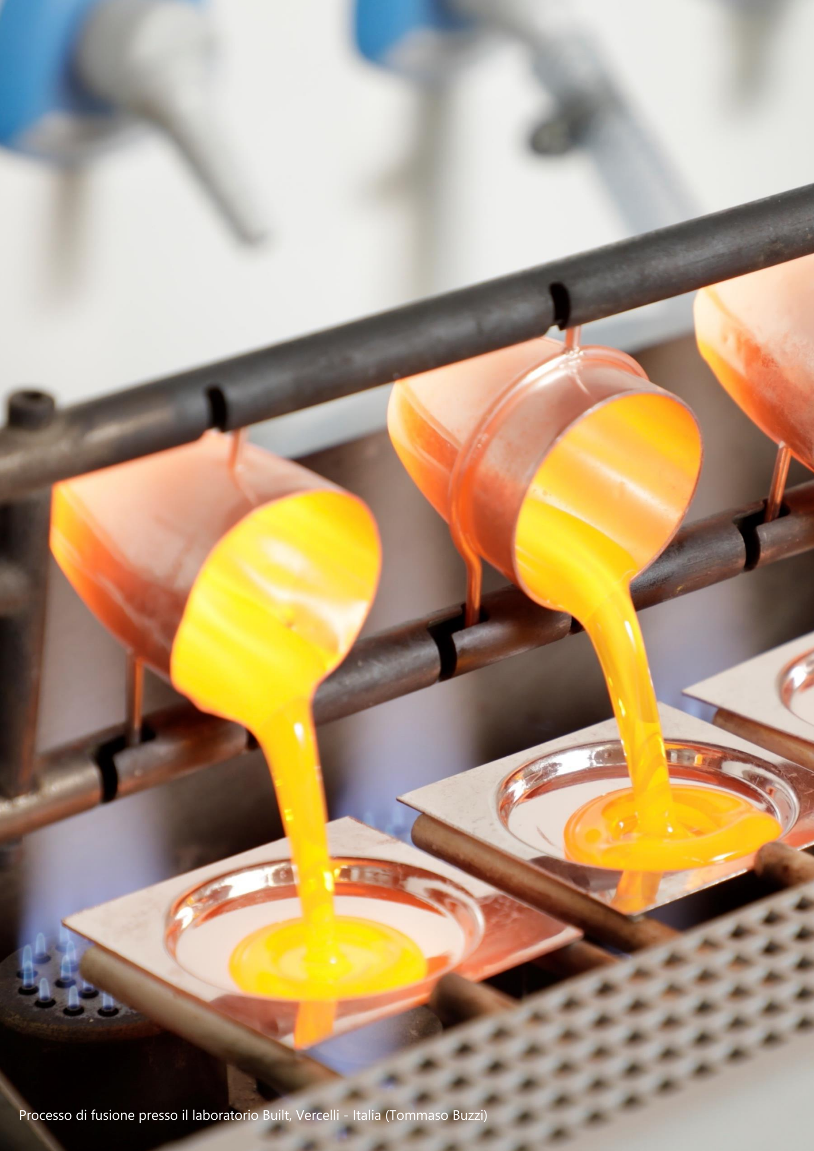
Processo di fusione presso il laboratorio Built, Vercelli - Italia (Tommaso Buzzi)