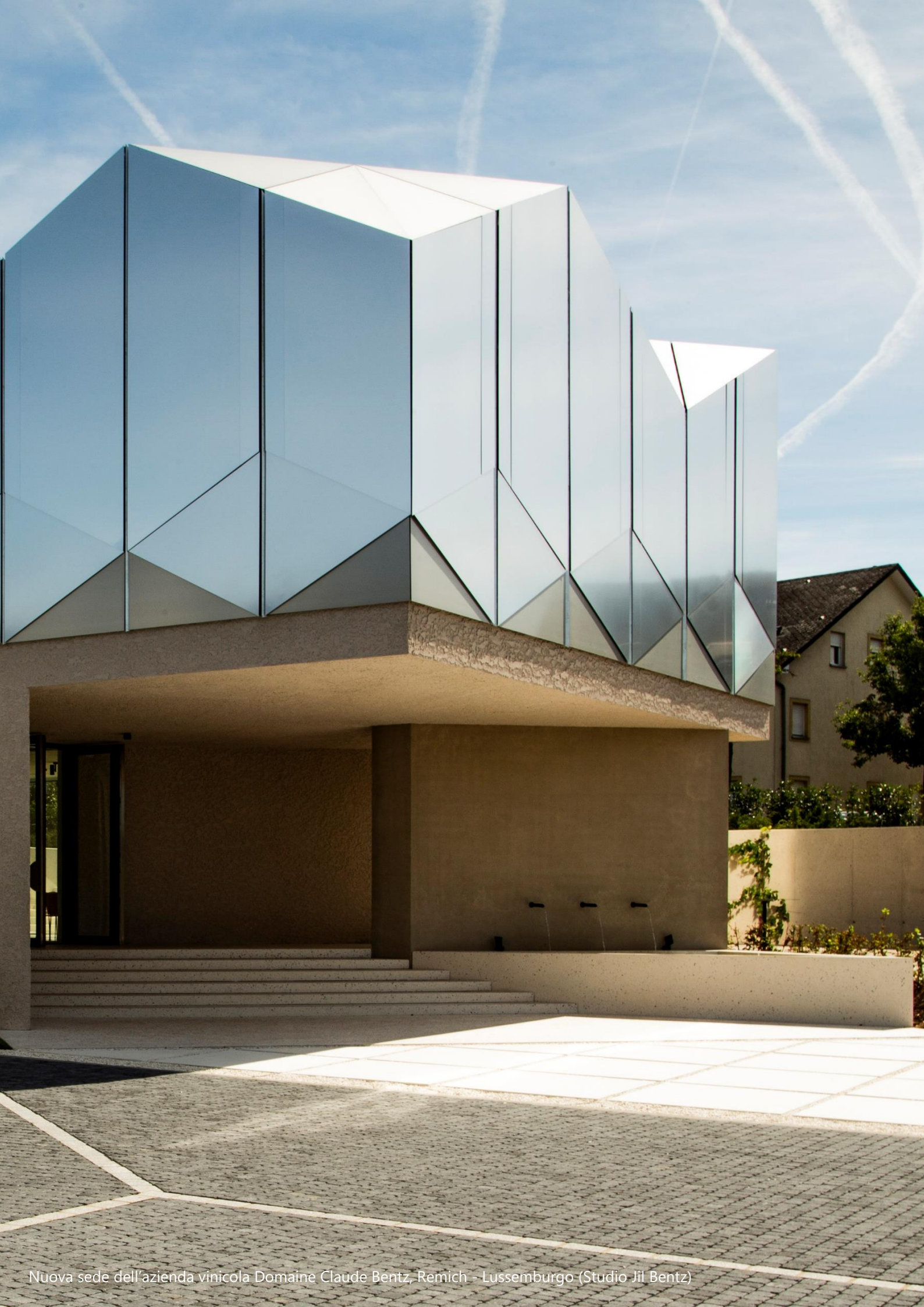
Nuova sede dell'azienda vinicola Domaine Claude Bentz, Remich - Lussemburgo (Studio Jil Bentz)