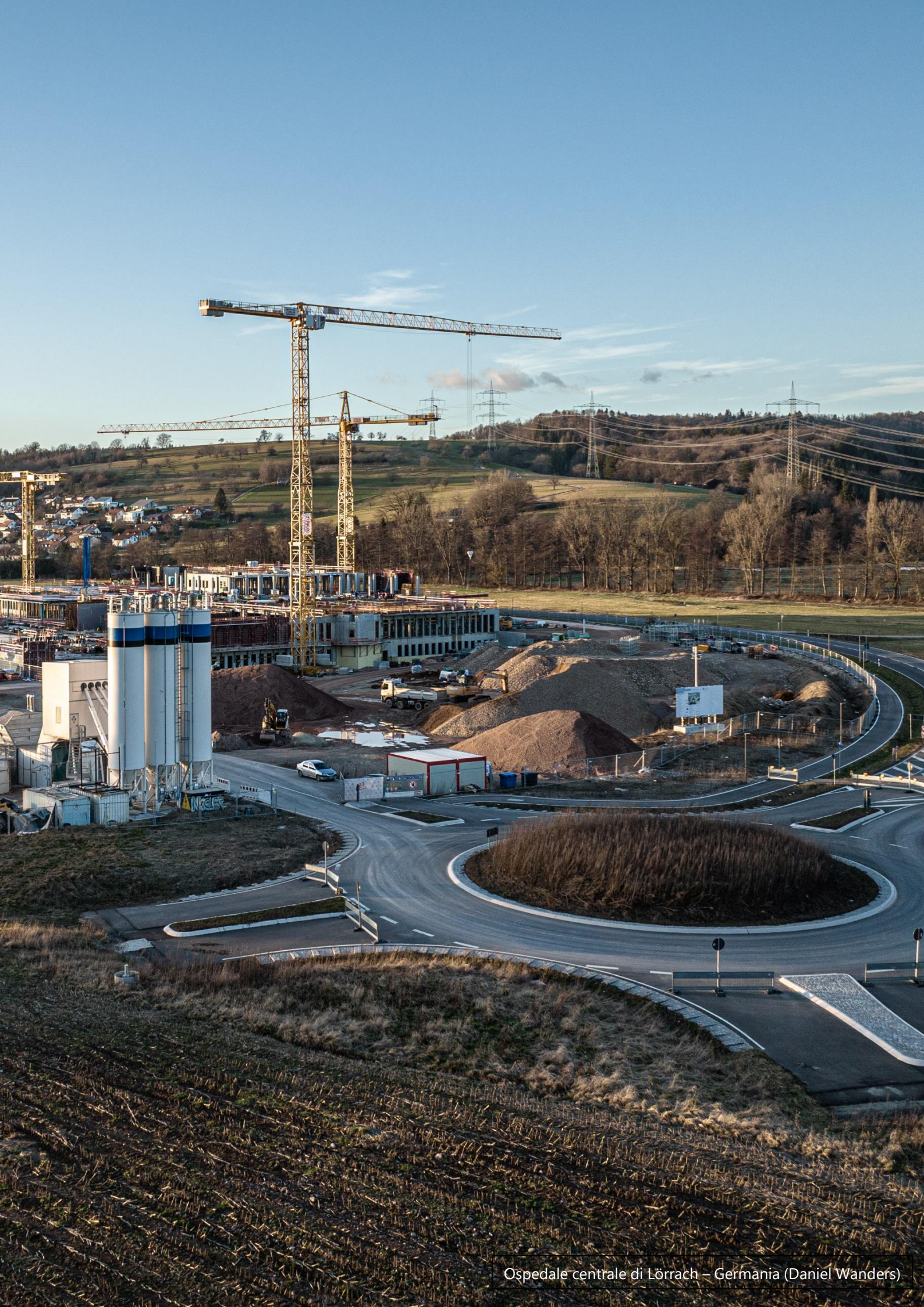
Ospedale centrale di Lörrach – Germania (Daniel Wanders)